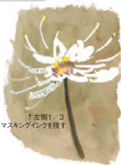
↑左側1/3 マスキングインクを残す

水彩紙は、ウォーターフォード、アルシュ、ストラスモア・インペリアル、ホワイトアイビスなど、強度のある紙をお使いください。もし、それ以外の紙をお使いの時は紙が破れることがありますので、端切れで試してからお使いください。