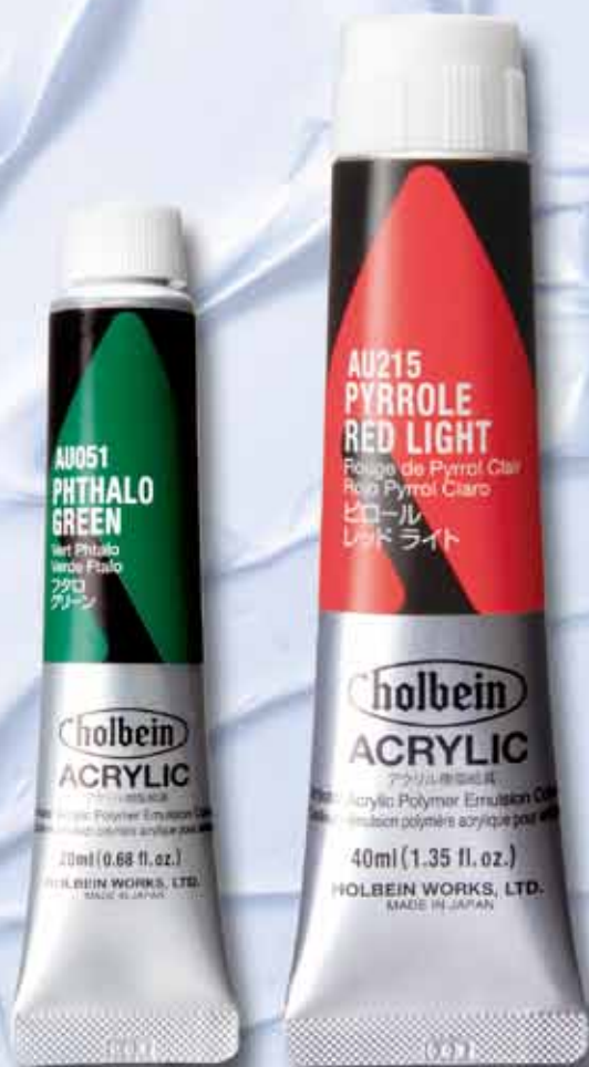
6号チューブ (20ml) No.6 tube (20ml)

We are excited to launch 113 of the highly anticipated acrylic colors for artists. Holbein Acrylic Colors are designed to offer vibrant, bright, transparency, viscosity, balance, and light-fastness to meet the artists' needs. Holbein Works Ltd. has 40 years of experience of research and development to produce high-quality colors at competitive prices.