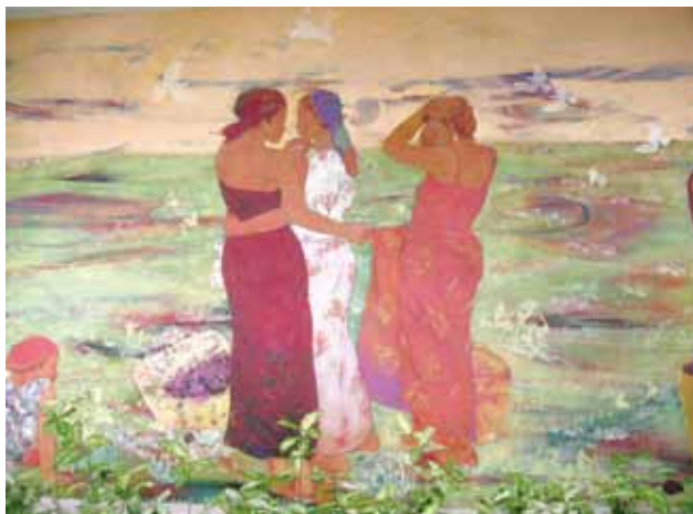
「風わたる」大阪天満橋OMMビル