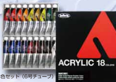
AU993 18色セット (6号チューブ) ¥4,900+税 18 colors set (No.6 tubes 20ml)