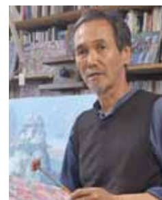
井上直久 INOUE Naohisa

1971年 金沢市立美術工芸大学卒業 1981年 画集「イバラード1981」を出版 1983年 絵本「イバラードの旅」で講談社絵本新人賞受賞 1995年 スタジオジブリ作品映画「耳をすませば」挿話「バロンのくれた物語」の美術作成 2002年 ジブリ美術館の壁画「上昇気流II」制作 2006年 ジブリ美術館でアニメ映画「星をかった日」上映 東京都文京区にイバラード常設アートスペースオープン 2007年 スタジオジブリ制作・井上直久監督DVD&BD「イバラード時間」発売