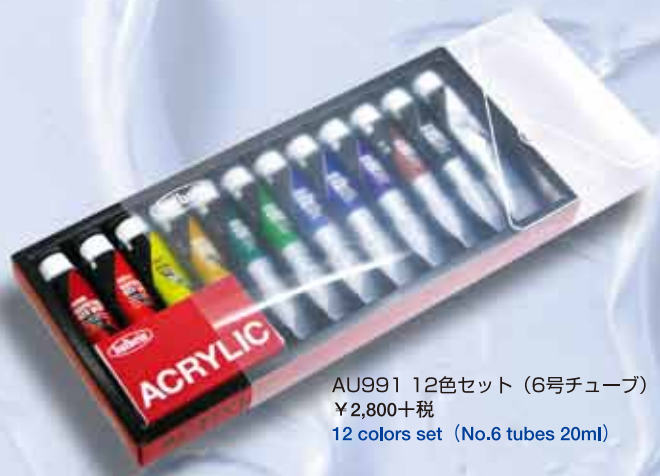
AU991 12色セット (6号チューブ) ¥2,800+税 12 colors set (No.6 tubes 20ml)