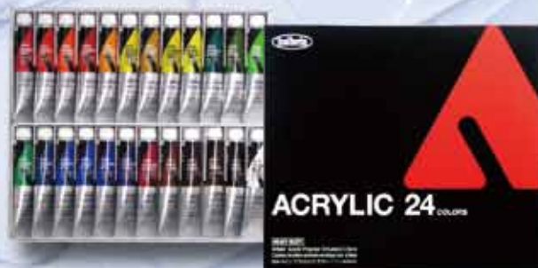
AU995 24色セット (6号チューブ) ¥7,100+税 24 colors set (No.6 tubes 20ml)