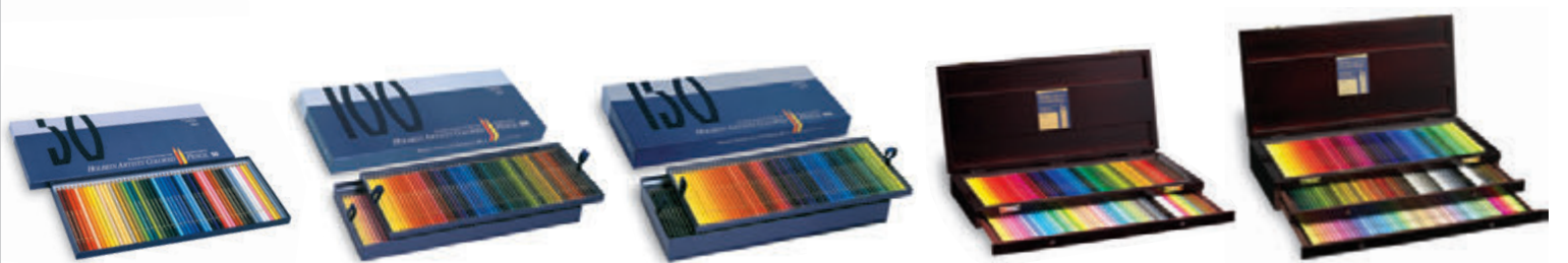
OP935 50色セット 紙函入 ¥11,000+税