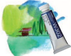
〈透明水彩絵具+色鉛筆〉 色鉛筆は細部の表現や部分修正など、補助的に使うと良いでしょう。

色鉛筆画の下地塗りに水彩絵具を使うと、色が厚みを持ちます。一方、いろいろな画材に色鉛筆を組み合わせることによっても、効果的な表現ができます。