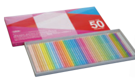
OP936 パステルトーン50色セット 紙画入 ¥11,000+税