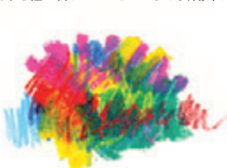
〈オイルパステル+色鉛筆〉 ナイフでスクラッチすると、下地の色鉛筆の色が線としてあらわれます。