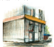
〈マーカー+色鉛筆〉 線部のディテールやハイライトの表現に、色鉛筆を使います。