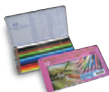
OP901 12色セット ベシットーン(基本色) メタルケース入 ¥2,750+税