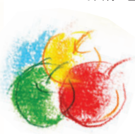
〈パステル+色鉛筆〉 パステルでぼかした上から、色鉛筆で輪郭線を描き加えます。