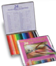
OP920 24色セット メタルケース入 ¥5,500+税