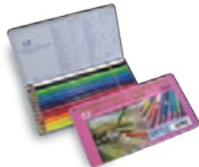
OP902 12色セット デザイントーン メタルケース入 ¥2,750+税