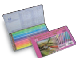
OP903 12色セット パステルトーン メタルケース入 ¥2,750+税