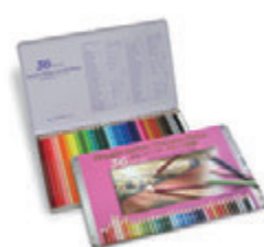
OP930 36色セット メタルケース入 ¥8,200+税